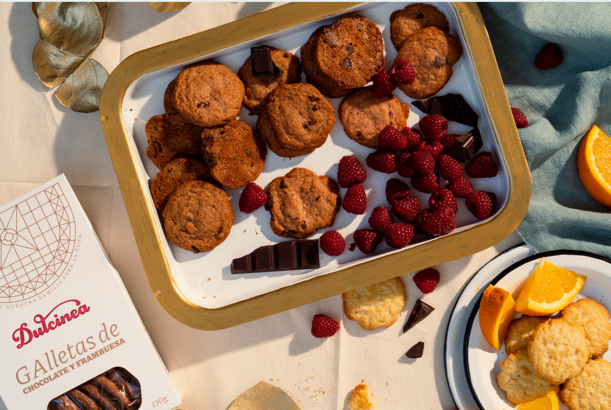
En foto: Galletas de Chocolate y Frambuesa